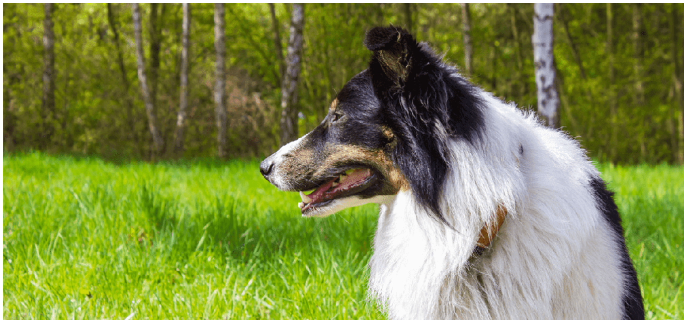
Metis Ciobănesc German * Collie